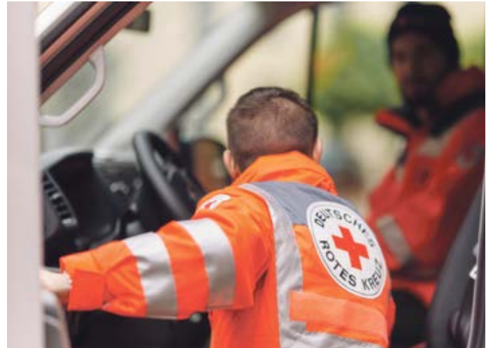
Rettungswagen, Krankentransport oder Taxi? Ob und welches Rettungsmittel im Notfall geschickt wird, entscheidet im Regelfall die Einsatzleitstelle für Rettungsdienst und Feuerwehr in Zeven

„Den Landkreis erreichen immer wieder Beschwerden von Bürgerinnen und Bürgern über hohe Rechnungen