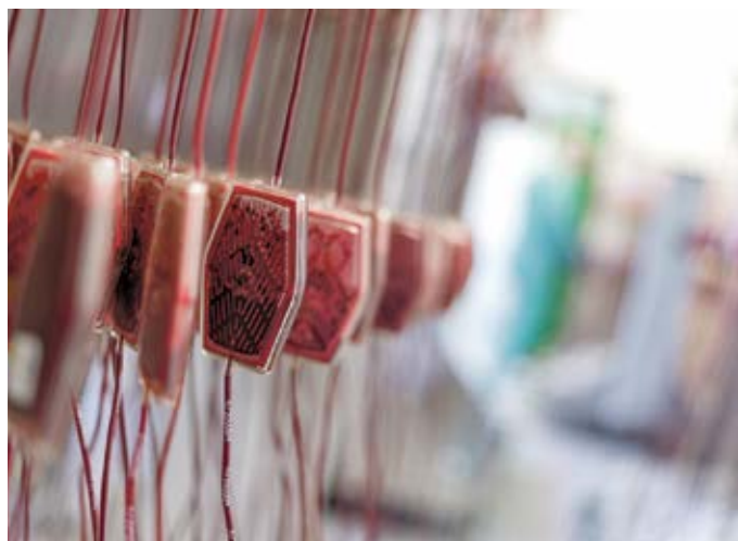
Für eine gesicherte Versorgung wird ein Mindestbestand von 10.000 Konserven benötigt

Bereits jetzt reichen einige Blutgruppen nur noch für wenige Tage, am stärksten