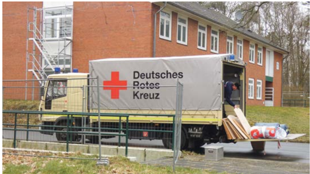
„Sachen packen“ heißt es für den DRK-Kreisverband Bremervörde am Standort Visselhövede. Der Landkreis Rotenburg schließt die Flüchtlingseinrichtung

Die Zuweisungen ukrainischer Geflüchteter durch das Land sind seit dem Frühjahr ausgesetzt. Ursächlich dafür