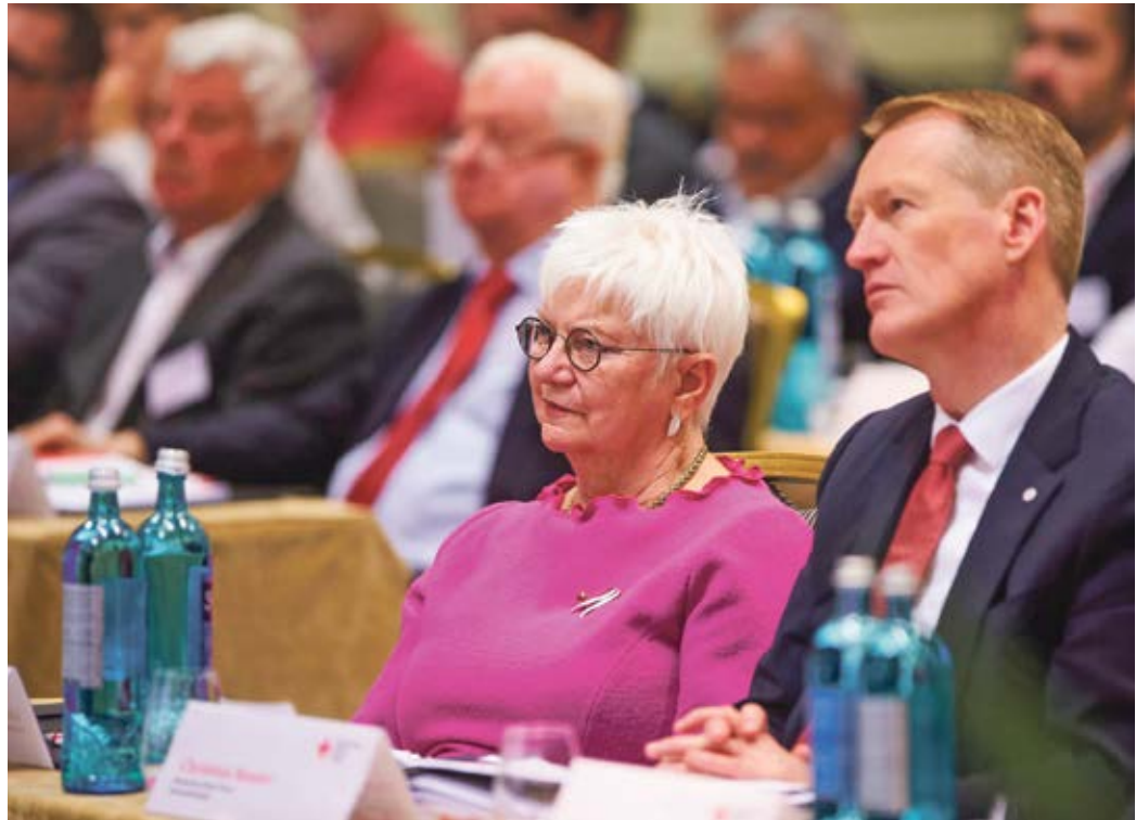
„Das beharrliche Drängen aller Verbände auf einen Haushalt, der den Herausforderungen unserer Zeit mit strategischen Investitionen im Sinne der Menschlichkeit begegnet, scheint sich ausgezahlt zu haben“, sagt DRK-Präsidentin Gerda Hasselfeldt (im Bild mit DRK-Generalsekretär Christian Reuter)

Unklarheit besteht noch über den Etat im Bevölkerungs-