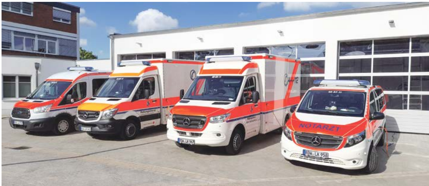
Einsatzfahrzeuge vor der 2022 neu errichteten Fahrzeughalle am Wachenstandort Bremervörde