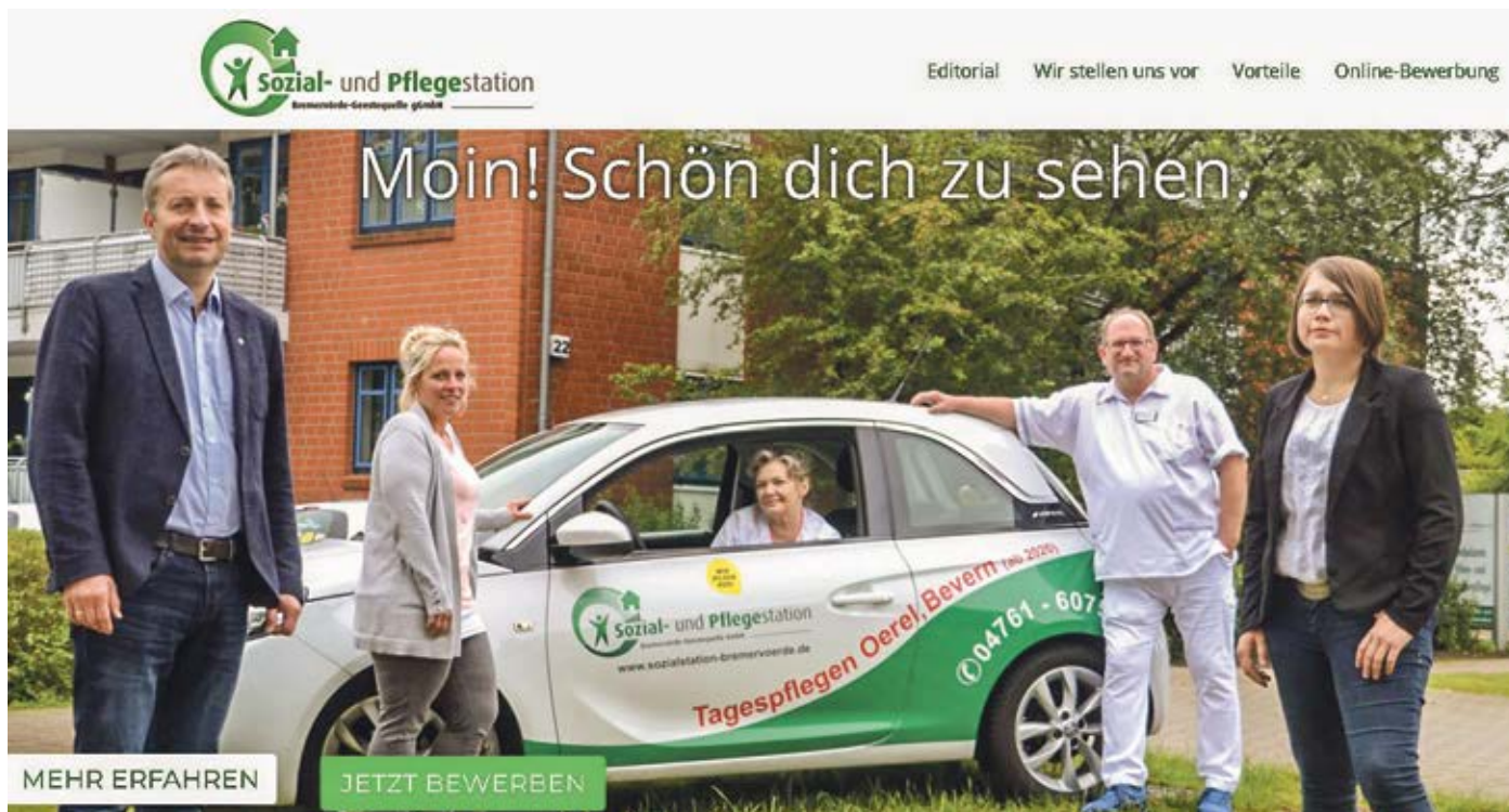
Die Bewerber-Homepage www.recruiting.sozialstation-bremervoerde.de bietet neben der Möglichkeit, sich mit wenigen Mausklicks auf aktuelle Stellenausschreibungen (auch denen der Tagespflegen Oerel und Bevern) bequem online zu bewerben, umfangreiche Informationen zu den Vorteilen der Beschäftigung in dem in Bremervörde beheimateten ambulanten Pflegedienst