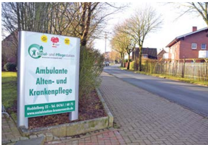
Neben einem ambulanten Pflegedienst betreibt die Sozial- und Pflegestation auch zwei Tagespflegen

Klingt abgedroschen, aber: Bei uns wird gerne arbeiten, für den Job nicht nur ein Job ist, sondern Berufung. Und es ist schön, dass das alle bei uns so sehen. stj