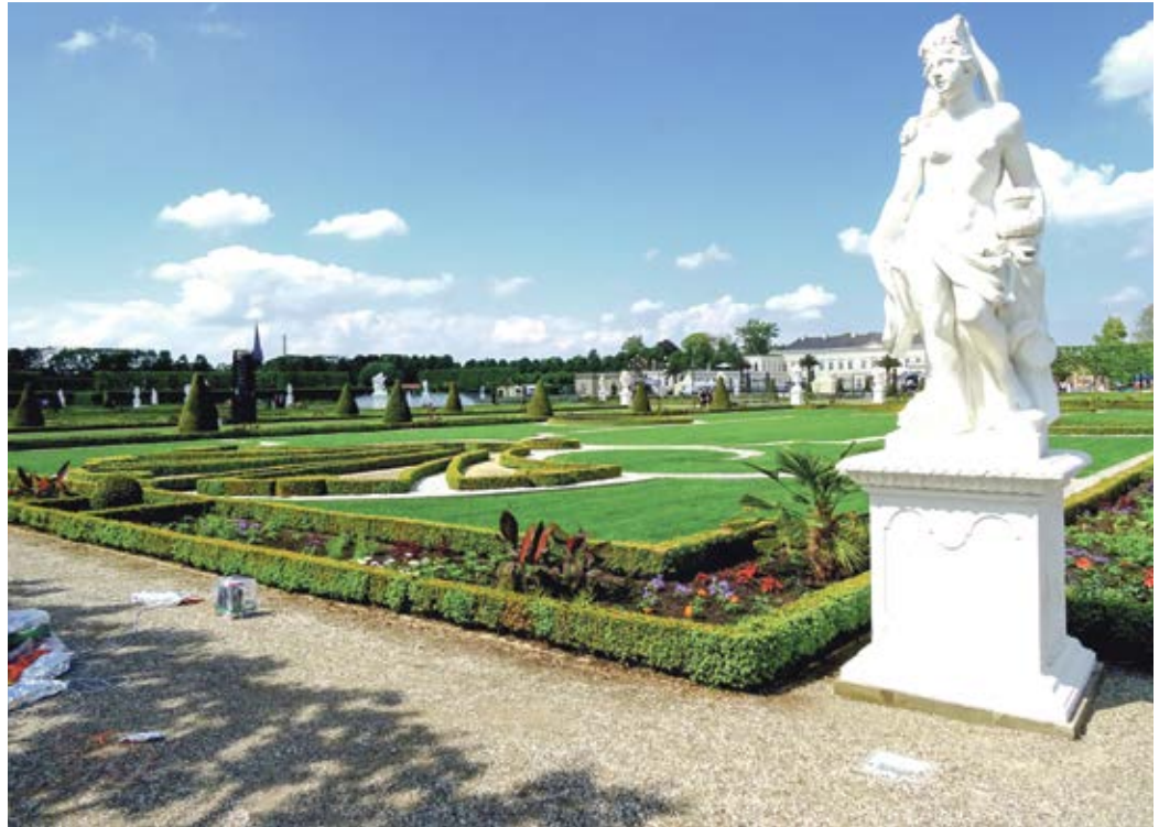
Wer einen Tagesausflug nach Hannover unternimmt, wie unlängst die Reisegruppe des DRK-Ortsvereins Klenkendorfer Mühle, kommt an den Herrenhäuser Gärten als Ausflugsziel nicht vorbei

Nach der einstündigen Führung ging es wieder zurück zum Reisebus und es begann eine nochmal so lange Stadtrundfahrt, ebenfalls mit ortskundiger Reiseleitung und wieder inklusive schöner Eindrücke der Stadt. Anschließend nahm die Gruppe ein Mittagessen ein. Weiter ging die Fahrt zu den Herrenhäuser Gärten. Auch an diesem Ausflugsziel wurde die Gruppe während des zweistündigen, kurzweiligen Rundgangs von Reiseführern