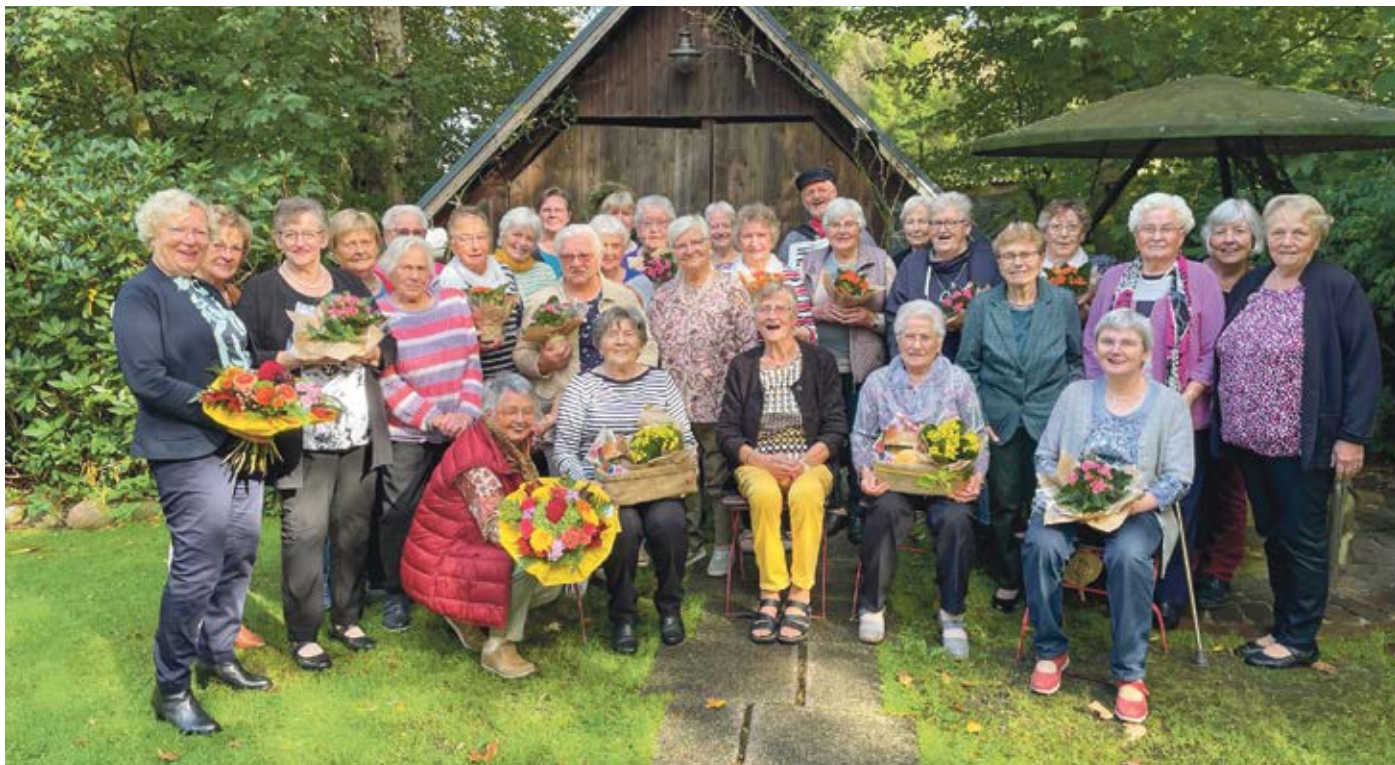
In der Gaststätte Zum Huvenhoop in Augustendorf wurde das 20-jährige Bestehen Anfang Oktober gefeiert