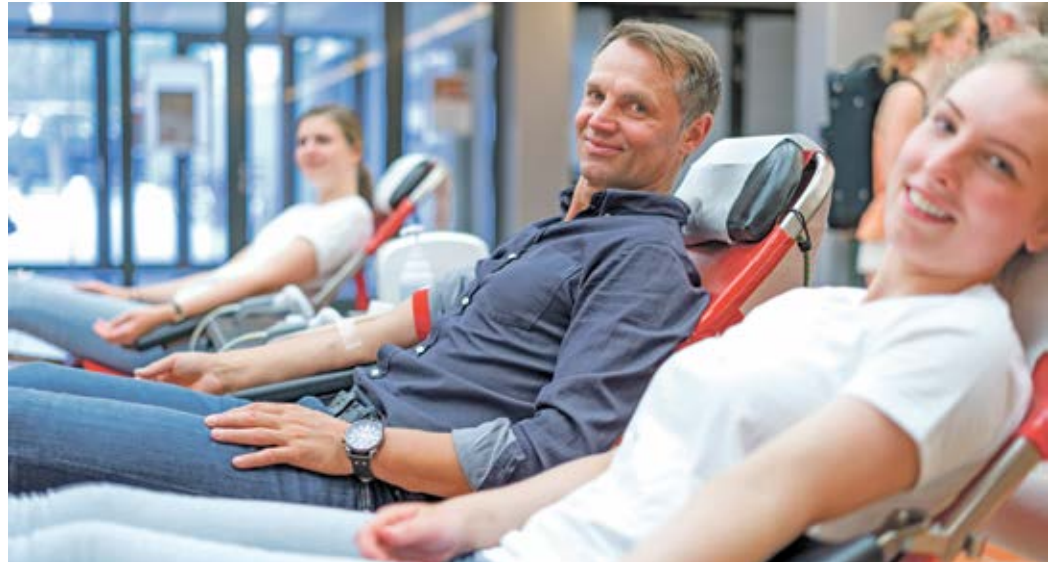
In diesem Jahr wurde die Richtlinie Hämotherapie von der Bundesärztekammer überarbeitet. Sie ist für alle Blutspendedienste bindend

In diesem Jahr wurde die Richtlinie Hämotherapie von der Bundesärztekammer überarbeitet. Sie ist für alle Blutspendedienste bindend und regelt sämtliche arzneimittelrechtlichen Prozesse rund um die Blutspende. Für die Spendetterminen ergeben sich daraus Änderungen: Somit darf jeder gesunde Mensch ab einem Alter