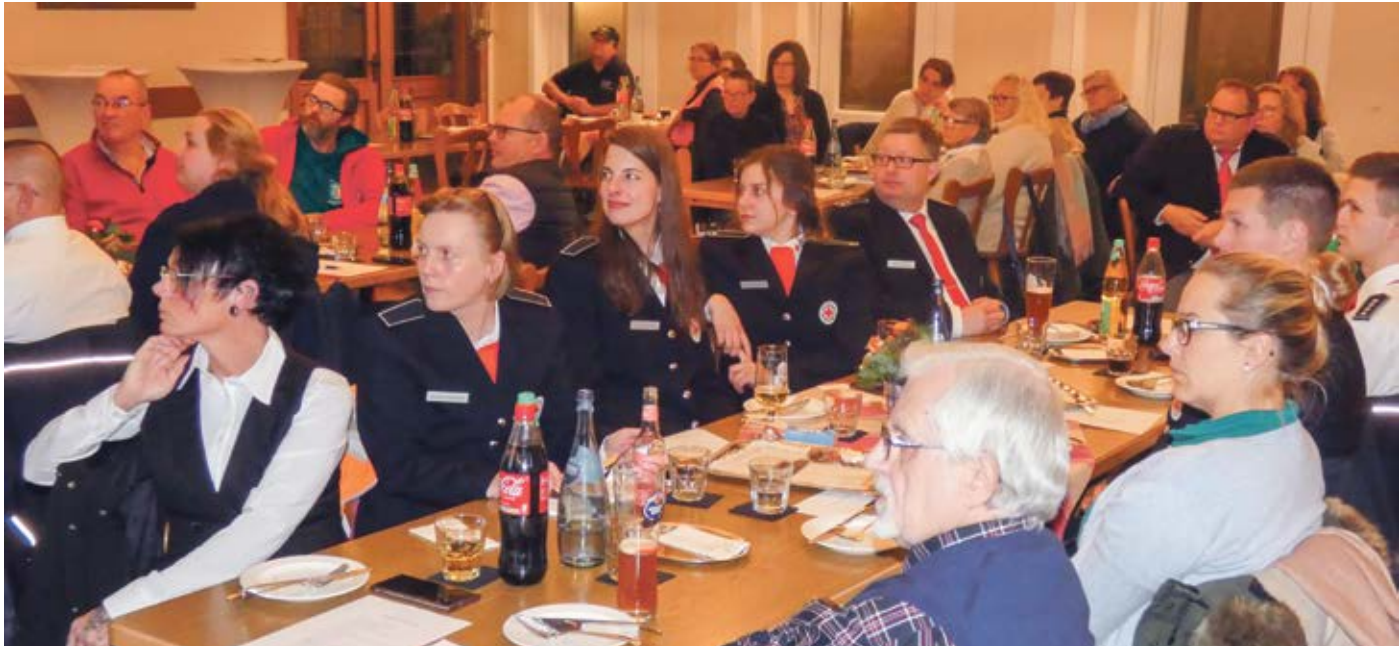
Mehr als 60 Delegierte aus zehn (von 16 Ortsvereinen) waren bei der Kreisversammlung in Brauel zugegen

schen fast 100 Erziehungsfachkräften, die nach den gut 200 Notfallsanitätern, Rettungsassistenten und -sanitätern die am zweithäufigsten vertretene Berufsgruppe innerhalb des DRK-Kreisverbandes Bremervörde darstellen. Ihnen folgen aus dem dritten Hauptaufgabenfeld mehrere dutzend Pflegefach- und hilfskräfte, die im ambulanten Pflegedienst oder den Tagespflegen in Oerel und Bevern beschäftigt sind (alles drei Einrichtungen der Sozial- und Pflegestation Bremer-vörde-Geestequelle, deren Mehrheitsgesellschafter das Rote Kreuz ist).