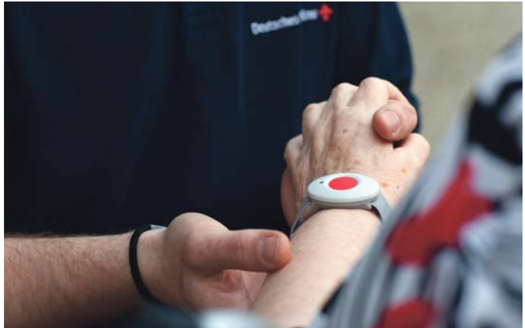
Der Hausnotruf, ein tragbarer Notrufsender, mit dem im Notfall auf Knopfdruck Hilfe angefordert werden kann, ist eine wichtige Dienstleistung, damit insbesondere Ältere und Menschen mit körperlichen Einschränkungen möglichst lange und sicher in ihrer gewohnten Umgebung leben können

eine wichtige Dienstleistung, damit insbesondere Ältere und Menschen mit körperlichen Einschränkungen möglichst lange und sicher in ihrer gewohnten Umgebung leben können.