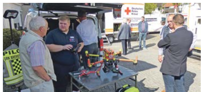
Publikumsmagnet Drohnenstaffel beim Jubiläum in Tarmstedt