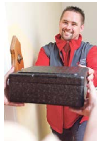
Menüservice-Fahrer bei der Essensauslieferung

Vor Jahren führte der DRK-Kreisverband Bremervörde in Zusammenarbeit mit appetito eine Befragung von Kunden durch, an die eine tägliche Heißanlieferung erfolgt. Demnach bewerteten annähernd 90 Prozent der Frauen und Männer die Betreuung durch den Mahlzeiten-dienst mit Blick auf telefonische Erreichbarkeit, Pünktlichkeit sowie Freundlichkeit als gut bis sehr gut. Rund 91 Prozent bewerteten die Menügröße als „gerade richtig“, die Optik wurde von 97 Prozent als „appetitlich“ eingestuft, 94 Prozent sind zufrieden mit der Vielseitigkeit. stj