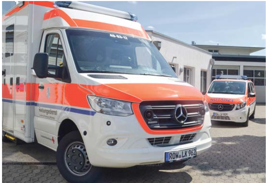
An der Rettungswache Bremervörde stationierte Einsatzfahrzeuge

Darüber hinaus fordert das DRK, dass der Rettungsdienst im gleichen Umfang wie bisher Aufgabe der Länder bleibt. „Der Rettungsdienst ist Bestandteil der Gefahrenabwehr und damit das Bindeglied zum Katastrophenschutz. Dies entspricht auch der europarechtlichen Einordnung des deutschen Rettungsdienstes. Die regionalen Versorgungsbedarfe sind auf Länderebene besser bekannt als auf Bundesebene, was eine flexiblere und schnellere Anpassung ermöglicht. Deshalb fordern wir ganz klar, dass der Rettungsdienst weiterhin Ländersache