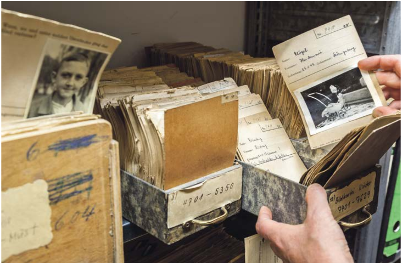
DRK-Suchdienst München, Zentrale Namenskartei (ZNK) mit Dokumenten zu Vermissten und Suchenden des Zweiten Weltkrieges, hier die Bildkartei der vermissten Kinder, Karteikarte mit dem Namen, dem Geburtstag und dem Geburtsort des Kindes