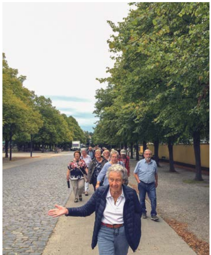
Hannover war gestern... Auch für 2024 sind wieder zwei Tagesausflüge der Klenkendorfer Rotkreuzler geplant